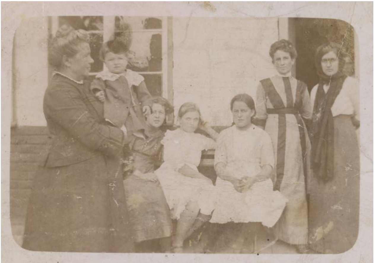
Из семейного альбома: во дворе дома Классен

Свадебная церемония проходила в церкви. Многие молодые пары, которые были приглашены, следовали за женихом и невестой и девушками-цветочницами, которые разбрасывали лепестки цветов на прогулке до самой церкви в длинной процессии. Люди теперь знали, кто с кем идет "всерьез", и ожидали, что вскоре последуют и другие свадьбы. Невеста всегда была одета в белое, а ее фата была закреплена миртовым венком в знак ее целомудрия. (Согласно старым фотографиям, обычай надевать белое и фату вошел в обиход только во второй половине XIX века). Жених надевал бутоньерку из белых цветов, скрепленную белой атласной лентой. После церемонии в экстравагантно украшенной цветами церкви процессия направилась в дом невесты для ужина и вечерних развлечений. Трапеза проходила за длинными столами, покрытыми белыми скатертями, которые были одолжены у соседей и друзей и украшены множеством ваз с цветами. Обычно еда состояла из