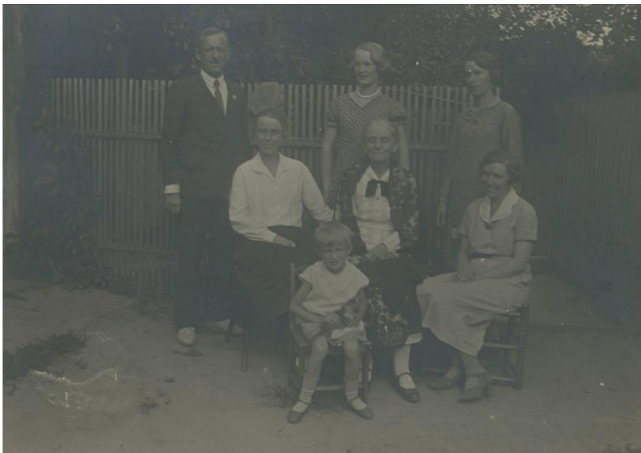
Из семейного альбома: семья моей бабушки

музыку для бальных танцев, таких как вальсы, а также народные танцы и, конечно же, сложные красивые чардаши. Для тех, кто не хотел танцевать, проводились игры, самыми известными из которых были Schlüsselbund and Grunes Gras. Schlüsselbund начинает мужчина, несущий тяжелый набор ключей. Он кланяется девушке, она берет его за руку, и они начинают прогуливаться по кругу, напевая знакомую песню. Все остальные присоединяются и следуют их примеру. Когда ключи брошены, все бегут на свои места; тот, кто опоздал на место, должен начать следующий круг. Иногда громко провозглашался выбор дам (Damenwahl), но он никогда не был очень популярен. Grünes Gras была похожей игрой в кругу с песнями, которые, должно быть, были привезены из Пруссии, причудливые и деревенские, с отсылками к монастырской жизни (Klosterleben), возможно, восходящими к Реформации.