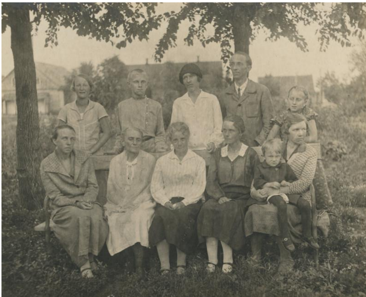
Из семейного альбома: родственники моей бабушки.

aunsajen". Эта система была очень эффективной. Таким же образом доставлялись приглашения на свадьбу и похороны.