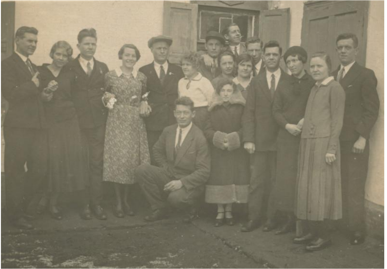
Из семейного альбома: нарядная молодежь.

Рассказ Elisabeth Peters. «Общение. Средства связи имели большое значение в то время, когда в довольно большом населенном пункте не было ни телефонной связи, ни доставки почты. Но новости и информация распространялись удивительно быстро. Официальные объявления, например, о деревенском собрании (Schuldebott), писались на листке бумаги (Zadill) в офисе мэра (Schult) и рассылались в каждую из четырех частей деревни. Дети, которые обычно несли Zadill соседям, были тщательно обучены доставлять их немедленно, и их проверяли после возвращения от соседей. К любому Zadill относились с уважением. Степень срочности передавалась одним словом: Foats (прямо сейчас). Если объявление было анонсом к очередному собранию, оно гласило: "Тоо Schulten onn wida aunsajen" (На деревенское собрание, и передай объявление). Если собрание было срочным, то оно гласило: "Foats to Schulten onn wieda